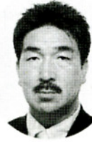
松山西高等学校同窓会会長